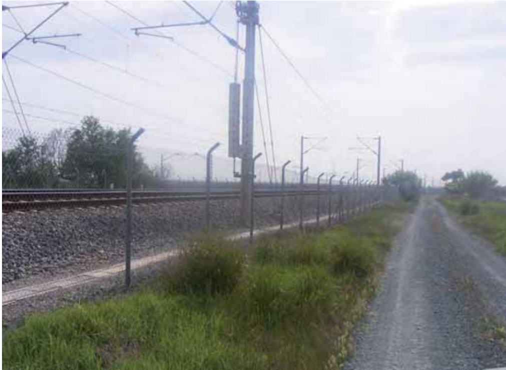
Foto 200 : Zahorra. Camino que permanece paralelo dos kilómetros entre AVE y carretera