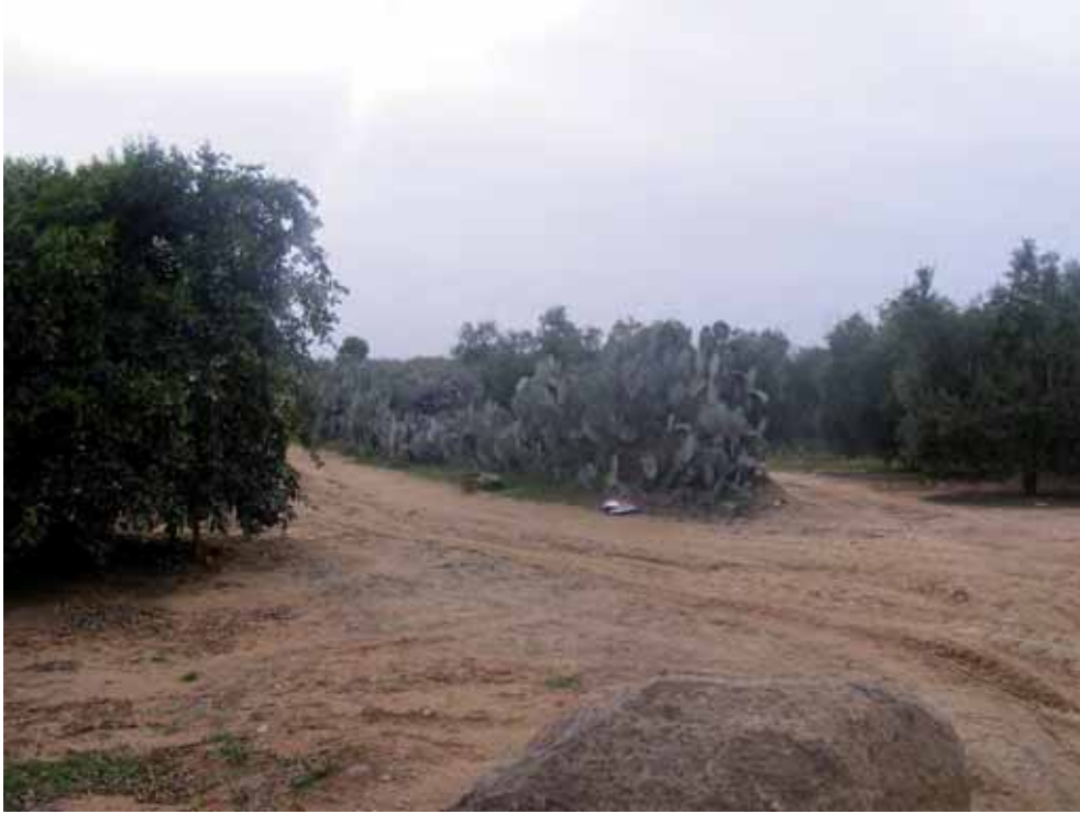
Foto 222 : Cruce en el Km. 15,70, dejando chumbera a la izquierda