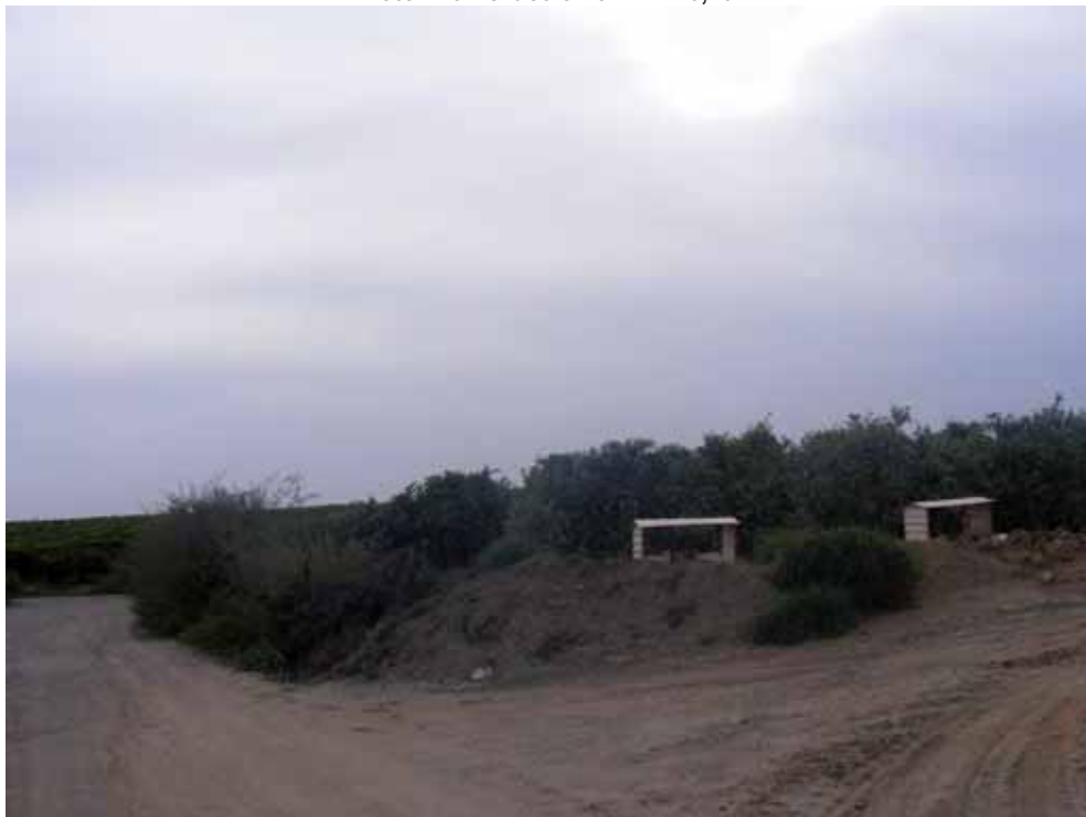
Foto 221 : Tomamos camino a la derecha. Cruce con camino alternativo 3 (si seguimos el camino nos encontraríamos con la carretera A-346, que la cruzamos, y continua por un camino paralelo a esta carretera hasta Alcolea del Río)