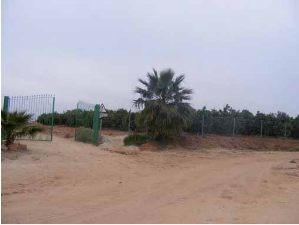
Foto 226: Puerta antes del Cruce con A-436. Llegada a Alcolea del Río