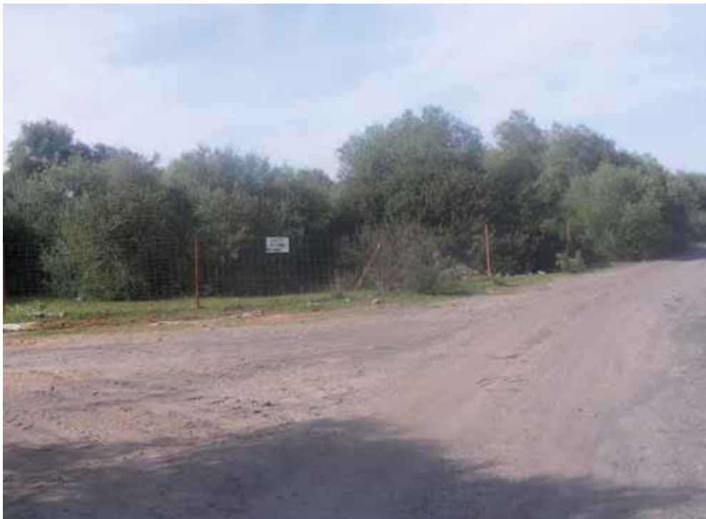
Foto 209 : Bifurcación al Cortijo de Los Premios. Dehesa y tierras de labor