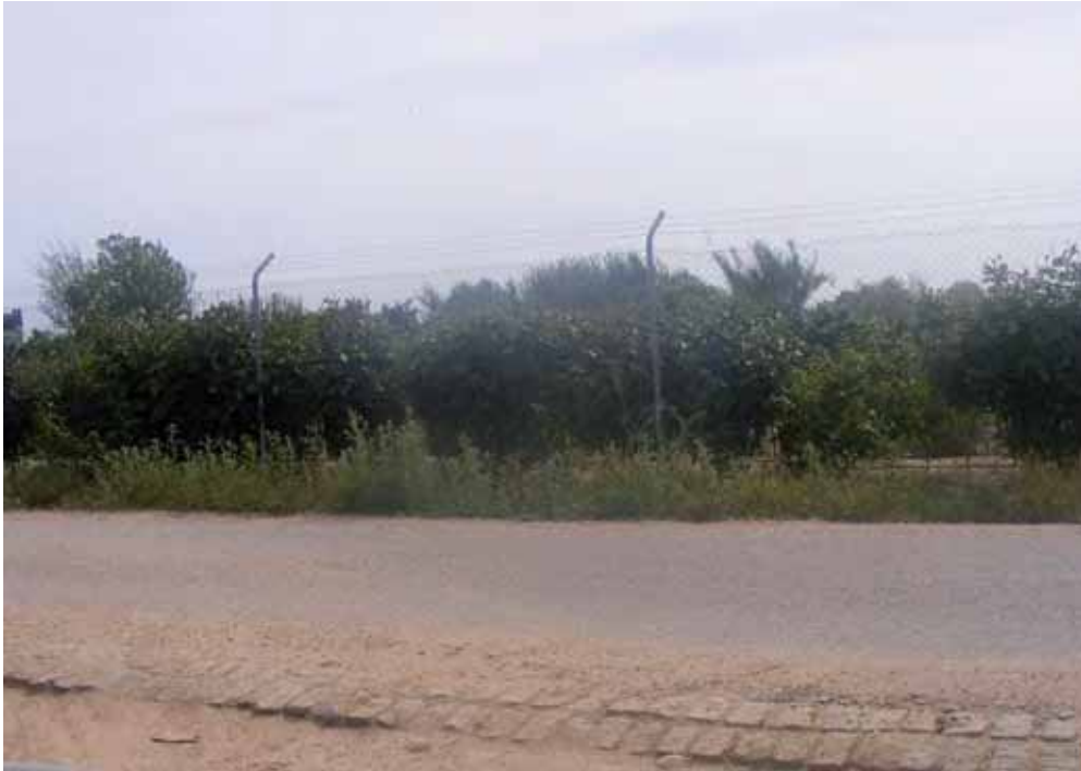
Foto 198 : Camino de enlace 1(enlace con Matallana a la derecha), seguimos a la izquierda. Camino de asfalto