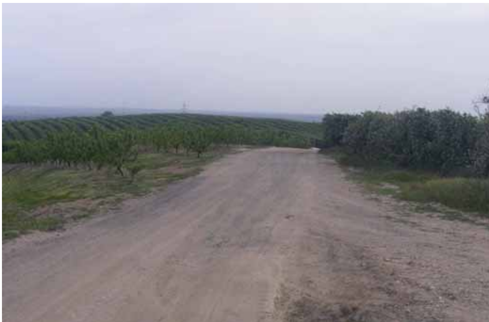
Foto 219 : Continuamos entre cítricos. Cruce por Camino alternativo 2 (va por la Cañada Real de Córdoba)