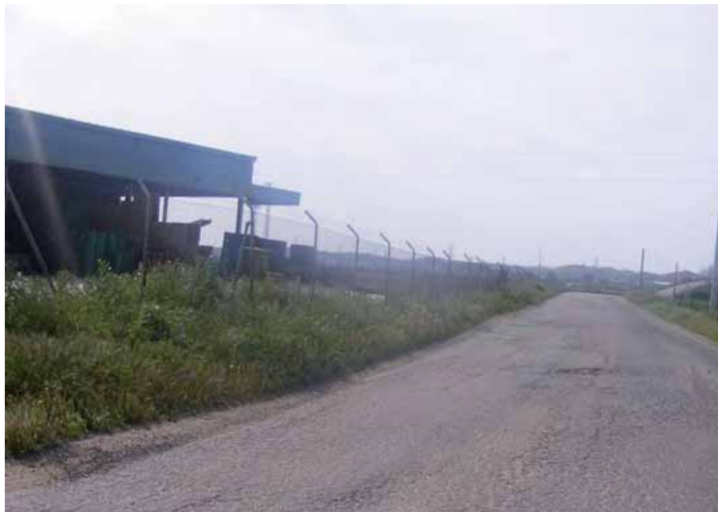
Foto 185 : Inicio en Lora en barrio El Barrero. Camino de asfalto