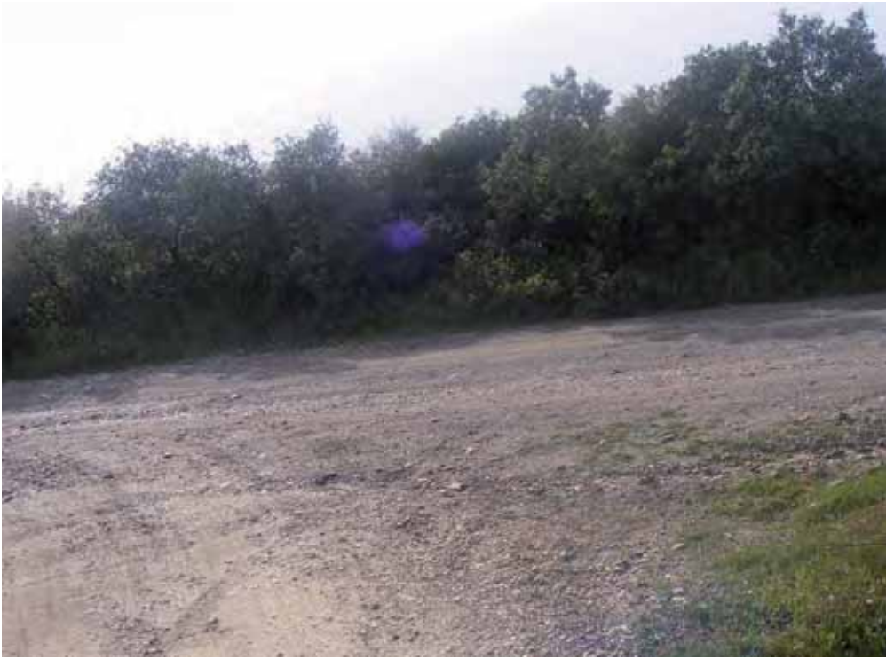
Foto 218: Tomamos a la izquierda. Cruce con Camino alternativo 1 (tomamos el cruce a la derecha y rodeamos hasta empalmar con el camino que conduce a la Ermita) a la derecha