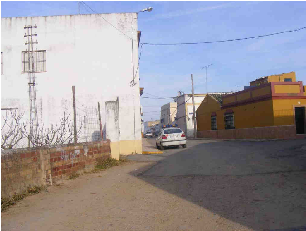
Foto 39: Llegada a calle Emperador Carlos V, en Tocina (Protección Civil y Policía Local)