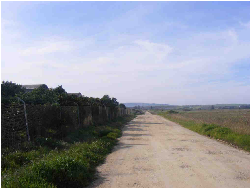
Foto36: Cruce en el Km. 10,00 (i)