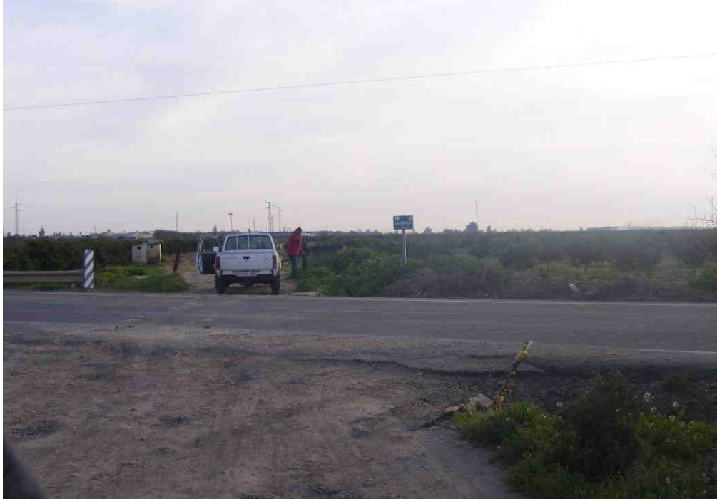
Foto 32: Cruce con la Carretera dirección Brenes-SE-3100. Sale un camino alternativo por la carretera a Brenes, a la izquierda.