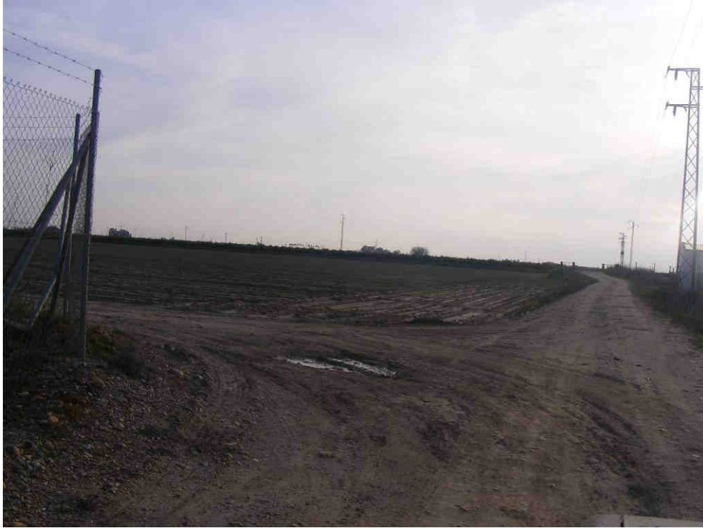
Foto 29 Cruce en el Km. 3,90